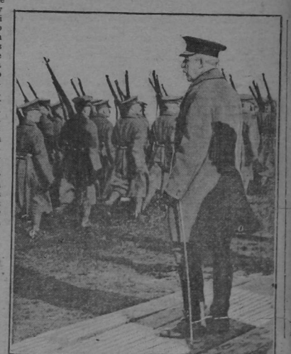
DUKE OF CONNAUGHT REVIEWING MONTREAL VOLUNTEERS